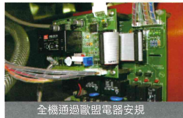
全機通過歐盟電器安規