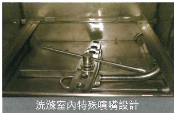
洗滌室內特殊噴嘴設計