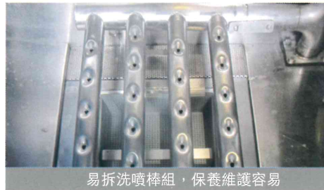
易拆洗噴棒組，保養維護容易