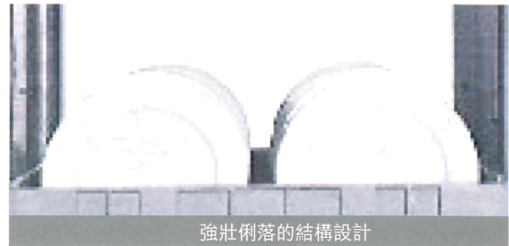
強壯俐落的結構設計