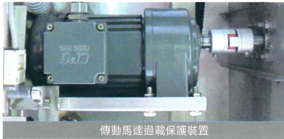
傳動馬達過載保護裝置

市場多年嚴峻考驗及淬煉下，不斷研發改良，強化結構性，提高洗滌品質。不僅有在地化生產優勢，價格更具競爭力外，並通過歐盟CE認證、食品安全衛生管理HACCP認證，行銷多國，真正做到國際規格本土價格。