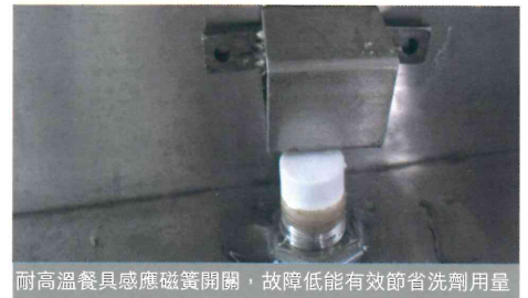
耐高溫餐具感應磁簧開關，故障低能有效節省洗劑用量